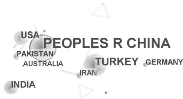
图 2 高产国家合作图谱

家中心度均不超过 0.03,表明中国在环锭纺纱领域相比其他国家创造力更强、影响更大。中国纺织品出口量居世界首位,中国纺织工业的健康发展不仅促进了中国经济发展,也极大地影响了世界纺织工业的发展,因此探讨分析国内环锭纺纱领域合作关系、研究热点与研究趋势对研究国际环锭纺纱领域的进展与转变有重要参考价值。