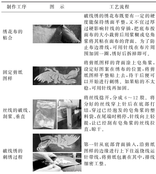
表1 破线绣的主要制作工序