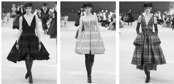
图4 礼服成衣设计图

装饰性,对现代服饰设计的创新和运用也带来无限的灵感启发 [8] 。元代青花瓷中的传统纹样为现代服饰艺术设计带来了无限的灵感源泉,增添了中国传统审美趣味与价值观,使现代服饰时尚具有深厚的历史文化背景,增强了服饰的整体气韵。变形莲瓣纹是由若干个点线面构成的装饰纹样,将其制作成面料纹样,并应用于现代礼服之上,将传统与现代时尚相结合,体现了人体曲线美在服装上的大面积应用设计,能够产生强烈的视觉效果,体现纹样的独特性(如图4)。