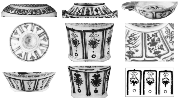
图2 元代青花瓷装饰纹样之变形莲瓣纹(《中国青花瓷》)

传承。当今,全球化的趋势越来越明显,人们对时尚与审美价值的追求也越来越高,将中国传统文化应用到现代设计当中,使其进入国际化市场,让更多的人认识它,充分实现自身的应用价值,同时也是对中国青花瓷装饰纹样的一种弘扬和不断创新发展。