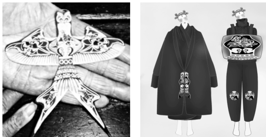
图4 “呢燕”原创效果图