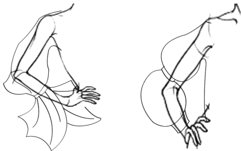
图3 现代华服拓展袖型

言具有丰富独到的魅力,运用这些图案纹样时特别要注意不能生硬地抄袭古人的线条和寓意。华服图案纹样设计依然要突出其吉祥如意,但要与服装设计款式相协调,不同的华服设计种类应具备详尽的纹饰分类,展现不同的寓意内涵 [6] 。如图4的设计,灵感来源于“北京扎燕风筝”,呢喃的燕子承载着人们对美好生活的向往,在图案的设计上尽可能地保留了文化底蕴,并通过抽象化的表现形式重新演绎大燕图,并以中国复古红为基色,充分展现出中国风情。其次,在继承传统手工艺技术,如刺绣、编织、印染等方法增加设计附加值的同时,还要与现代的工艺技法,如数码印花、植绒烫花、烫钻等现代工艺处理加工手法相结合。随着工业化变革和行业发展,以及工艺加工处理方法的不断更新,华服的工艺制作过程也会不断地丰富和发展。