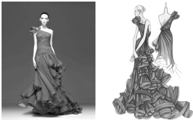
图1 绘画与服装设计

还要有一定的设计表现能力,才能够更好地将服装设计理念转化为一定形式上的效果表现,如图1所示。