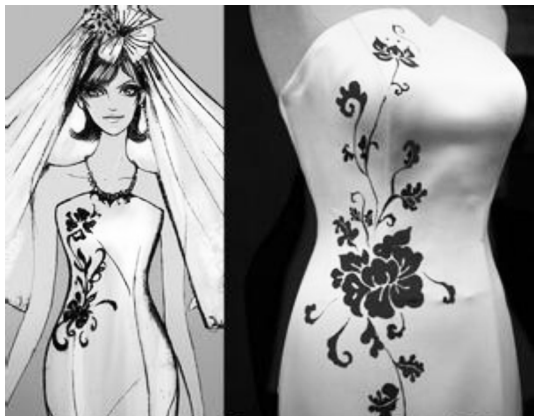
图3 手绘图案在服装设计中的应用

在服装设计中,图案对于服装设计师绘画基础的要求十分高,只有具有良好的绘画基础,才能够创造出更加美丽的图案,才能够设计出更加美观的服装 [4] 。例如,碎花是一种比较常见的图案设计,在时代的变迁中深受女孩子的喜爱,它表现出大自然中最清纯质朴的情愫,也代表着希望与梦想,表现在服装上面,既能散发出小女人的味道,清新自然,又能让人看见希望和阳光,心情舒畅,如图3所示。