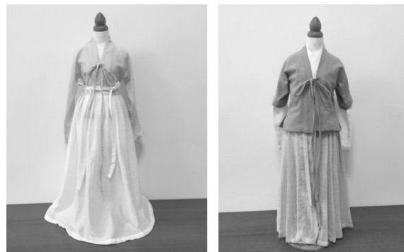
图2 汉服上衣下裳实物图

汉服最典型的款式是上衣和下裳分开,如图2。《说文解字》中:裳为“常”的异体字。“常,下裙也。”康熙字典对“常”的解释为:shang:泛指衣服。cháng:古人穿的一种遮蔽下体的衣裙,男女都穿,是裙的一种,不是裤子。