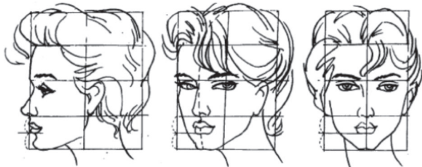
图4 不同角度的人脸

往往只练习单个感官的透视,例如练习正面的鼻子、3/4侧的鼻子、正侧的鼻子、仰视的鼻子以及俯视的鼻子,如图4所示,这样也会出现3.1里面的单一问题,只会画某一感官的透视角度,将其他感官放在一起时,会出现眼睛斜、嘴歪或者鼻子不正等透视不统一的问题。