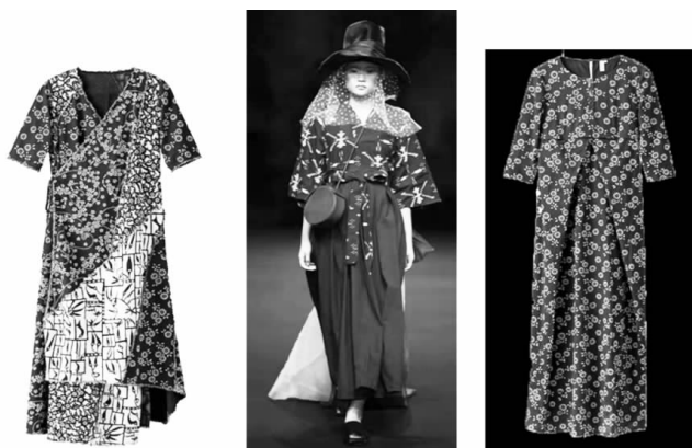
图6 生活在左 2019 春夏发布会

完成,这将花费大量人力物力和时间成本,随着科技的进步,部分制作过程可以通过现代先进的工艺技术来完成,以便更好地进入市场,这将是传统技艺现代化的必经之路,其目的是更好地将文化驻扎于大众视野,更有利于融合与竞争。并且,通过线上线下大力推广,拓展天门蓝印花布传统工艺品的销售渠道,在一些标志性场所集中展示、宣传、推广。首先建立天门市文化活动街区,展览以蓝印花布为主的文化品,聚集游客参观并开展相关的旅游活动,增加天门市的文化输出。其次以湖北省为平台,举办传统工艺博览会和传统工艺大赛,促进全国乃至国际的传统工艺交流和学习,为传统工艺搭建更多展示隐性交易平台。在现代互联网消费时代,网上购物交易平台更是我们的主导市场,通过手机 App、微信科普宣传非遗最新资讯,建立非遗全球化模式,最终实现非物质文化遗产共融互通的世界性趋势。