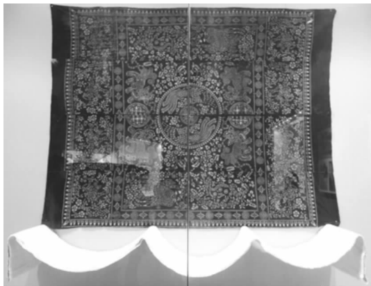
图1 湖北天门蓝印花布

代,由于土布和土靛的缺乏,企业开始倒闭,直至1984年天门蓝印花布场停止了生产 [8] ,年轻人开始寻求其他出路,而老艺人也都年事已高,无法再进行蓝印花布制作,逐渐只剩下少数以此为生计的家庭作坊。现今,湖北地区传统印染文化与技艺的保护由天门蓝印花布和传统植物染料染色两项省级非遗项目构成,由于国家对于非物质文化遗产保护的重视,湖北天门蓝印花布的濒危状况已经引起关注。