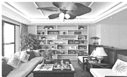
图6 夏布布艺软装饰与室内绿化的配套设计