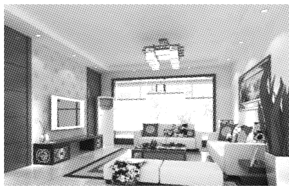
图7 夏布布艺软装饰与家具的配套设计

中。夏布在新时代特征下,用新的语言呈现于新中式风格室内设计中,使其相互融合,能更好地传承和保护民族文化。