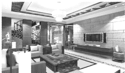
图4 夏布布艺软装饰之间的配套设计

夏布布艺软装饰与室内其他装饰物的配套设计,不仅要求夏布布艺软装饰本身的每一个独立的局部和整个系列配套,而且必须与室内设计的硬装和其他软装相配套。如大多数中式家具颜色较深,夏布软装饰则可以采用现代元素加以调和,采用浅色或较为明朗的色彩及传统图案装饰的窗帘、坐垫、靠垫,可营造出舒适清朗的空间感。如图6所示,夏布可采用一些绿色植物的纹样与室内绿化相呼应,表达出一种自然惬意的感觉。如图7所示,夏布布艺纹采用与室内的灯具纹样、墙面图案等类似的纹样,以达到统一和谐。