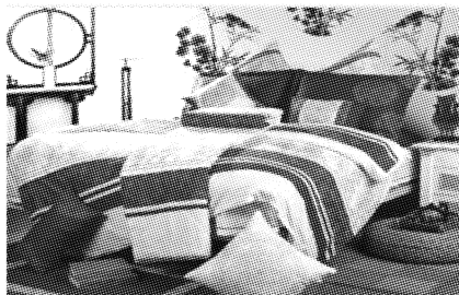
图5 夏布床上用品配套设计

夏布布艺软装饰以其特性运用于室内环境,特点鲜明;与新中式风格相配套不但要达到其自身的完整性,而且要与室内其他装饰物协调统一于新中式风格