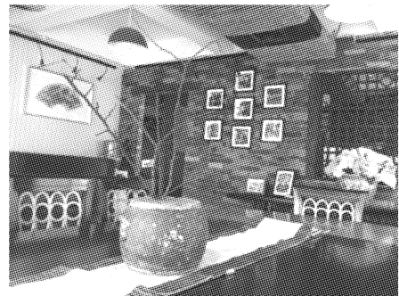
图3 夏布软装饰衬托作用